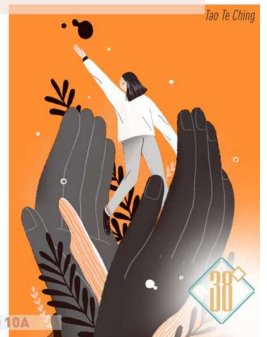
Tao Te Ching

Поэтому, чтобы сделать мир лучше, нужно просто уважать других и себя, развиваться, меняться в лучшую сторону.