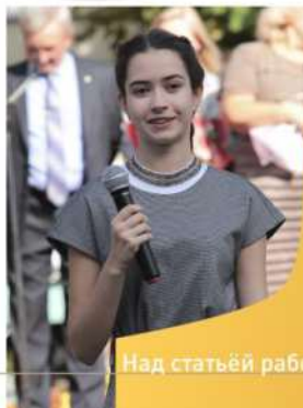
Над статьёй работала Полина Долгушина 10Б