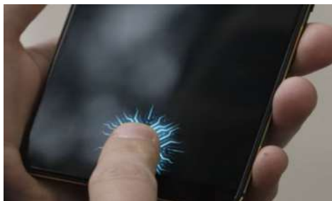
Разработка компании Vivo

Те, кто попробовал такое нововведение, говорят, что несмотря на задержку в работе, сама механика очень естественна и очевидна, как будто вот так и должен выглядеть сканер отпечатка пальца.