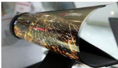
LG UHD Rollable OLED

Представьте, 65-дюймовый экран выезжает из квадратной коробки, как будто это какой-то фокус. У телевизора экран OLED, поэтому он выдаёт такую же качественную картинку, как и его менее гибкие собратья по модельному ряду.