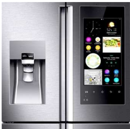
Холодильник Samsung Family Hub

Vivo использует недавно анонсированный оптический датчик Synaptics, который находится в разработке уже много лет. Он просматривает промежутки между пикселями на OLED-дисплее (ЖК-дисплеи не работают из-за необходимости подсветки) и сканирования вашего уникально узорчатого эпидермиса.