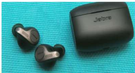
Беспроводные наушники компании Jabra

На выставке показали Bluetooth-наушники, и можно сказать, что они смогут составить конкуренцию великим AirPods (беспроводные наушники от компании Apple, выпущенные в 2016 году). И показала нам их компания Jabra.