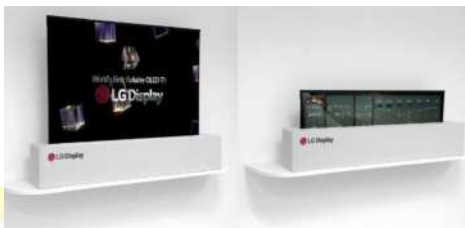
LG UHD Rollable OLED

У телевизора есть еще особенности – экран может быть развернут как полностью, так и наполовину.