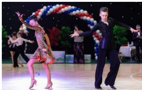
Турнир по спортивным танцам